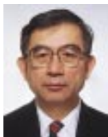
回答 東京都立大久保病院 院長

その第一は、家族性大腸ポリポシス(大腸腺腫症)といわれる疾患です。これは、大腸や胃などの消化管にポリープが広い範囲に無数にみられ、その中のいくつかが非常に高い頻度でがんに変化する疾患であり、メンデルの法則に従って優性遺伝します。大変稀な疾患ですが、普通はがんのみられる頻度の少な