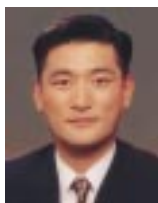
回答 山形県立日本海病院 院長

血液中のカルシウム値が高くなると幻覚や脱力感、食欲不振が、低くなると歯や骨の形成障害、知覚過敏、疲れ、成長障害、筋肉のけいれんやこ質問にある骨粗鬆症などの症状がでてきます。血液中のカルシウム値は上限と下限がしっかり調整されていて、食物から摂取する分には健康な人であれば異常値を示すことはめったになく、またカルシウム補給剤でも医師の指示通りに行えば、特に問題となることはありません。