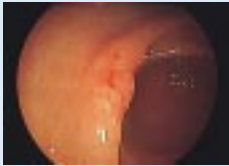
普通の観察の早期胃がん

液は、粘膜に吸収されて粘膜模様を明らかにして、小さな腫瘍の診断や粘膜の炎症の状態を判断するために使われています。