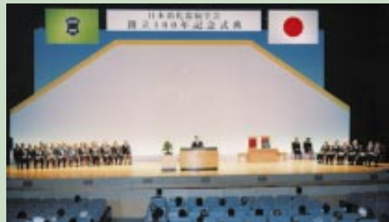
創立100年記念式典にて、おことばを述べられる皇太子殿下

日本消化器病学会は、今年で創立100年を迎えました。1898年(明治31年)に開かれた第1回胃腸病研究会(創設者・長与称吉)が出発点で、そのときの演題は「栄養」「がん」「感染症」「胃腸の生理学」でした。これらのテーマはその後の研究や臨床により目覚ましく進歩を遂げ、今なお消化器病学の原点として引き継がれています。