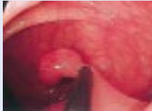
内視鏡的にポリープを切除しているところ

最近では、内視鏡そのものの改良と検査の技術の改善で、検査の時間は短くなり、受ける方の苦痛も少なくなりました。さらに、検査で見つかったポリープや、小さながんを内視鏡で治療することもできます。