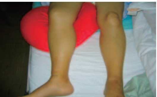
Figure 3. 下肢の腫脹