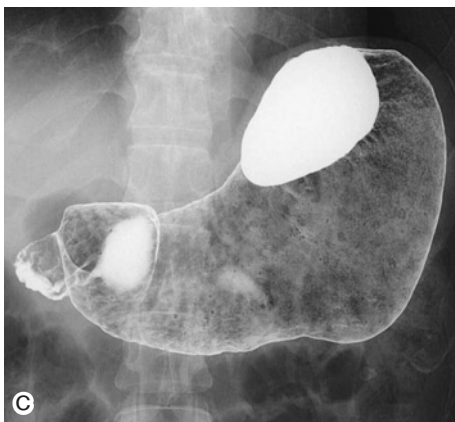
Figure 1c. 胃透視.