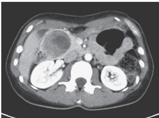
Figure 1. CT写真.