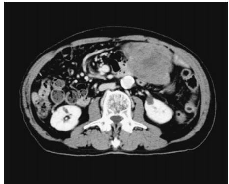
Figure 1. 腹部CT造影像.