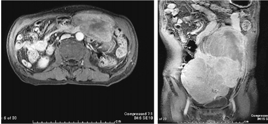
Figure 2. 腹部 MRI 脂肪抑制 T1 強調画像.