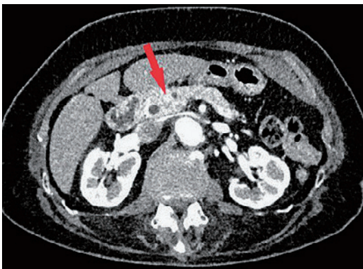
Figure 1. 腹部造影CT検査.